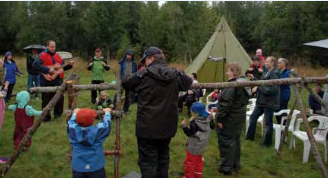
Bilde frå Lavvosamlinga.

Ønsket om mer aktivitet rundt gudstjenesten i Røbekk Kirke utenfor Molde, ble starten til den ferskeste KM-enheten i Møre og Romsdal, Prestsletta familiespeiding. En tidlig høstdag i 2007 inviterer et engasjert ektepar naboer og kirkegjengere i Røbekk til hageselskap med tema: Hva skal til for å få mer aktivitet i kirka? Flere forslag kom opp, og mange ønsket mulighet til å bli bedre kjent med de man treffer på gudstjenesten. Det resulterte i første omgang i en utvidet kirkekaffe på Prestsletta. Prestsletta er en åpning i skogen rett ovenfor Røbekk Kirke. En Lavvo ble kjøpt inn og enkle naturleker for barna ble laget rundt om på sletta. Den første samlingen ble en suksess. Lavvosamlingene var for alle som ønsket en enkel