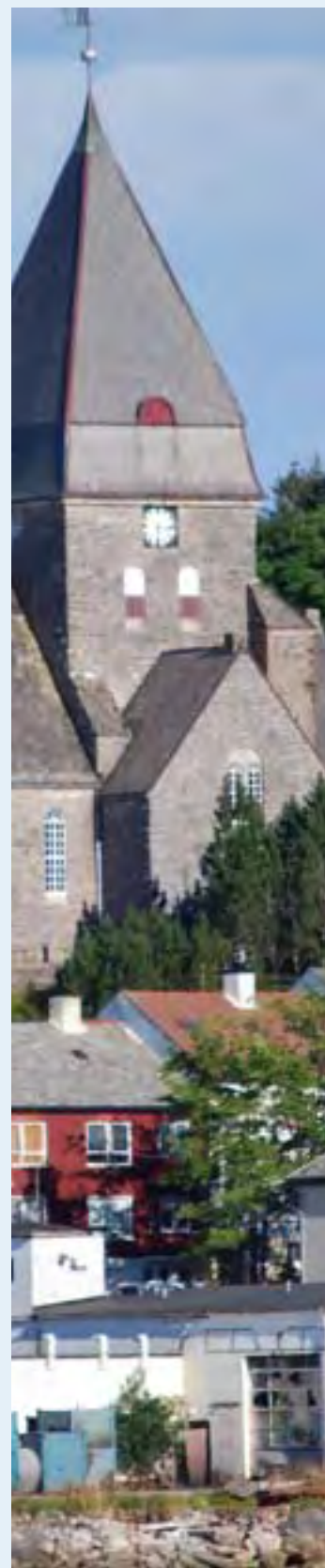
Parti frå Kristiansund