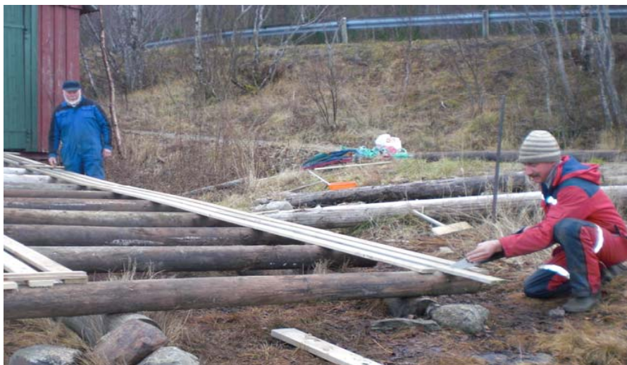
Bildet viser Helge Gutvik (Bindal) og Helge Sørø (Vikna) ved den solide og flotte båtstøa de gjorde ferdig på årets høstdugnad.

Veden varmer flere ganger, noe som sto i fokus da 14 av Sømløyas venner var samlet til dugnad.