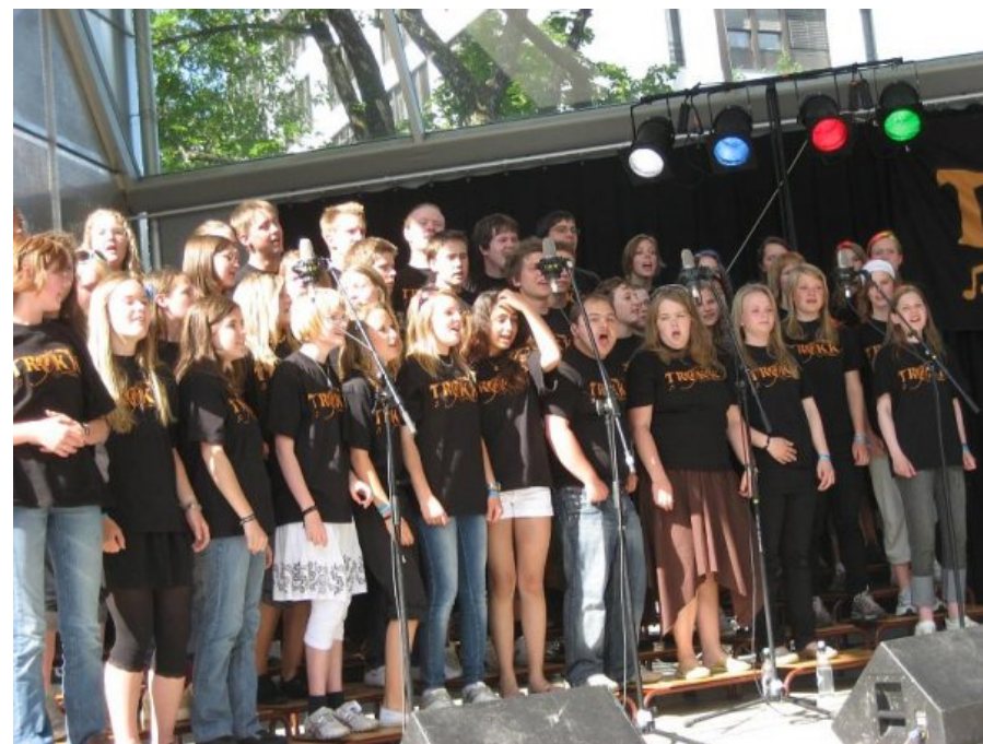
Trøndelag kretskor (TRØKK) under TT:07 på Gjøvik.

TT står for Tenåringstreff, og er en opplevelse for livet.